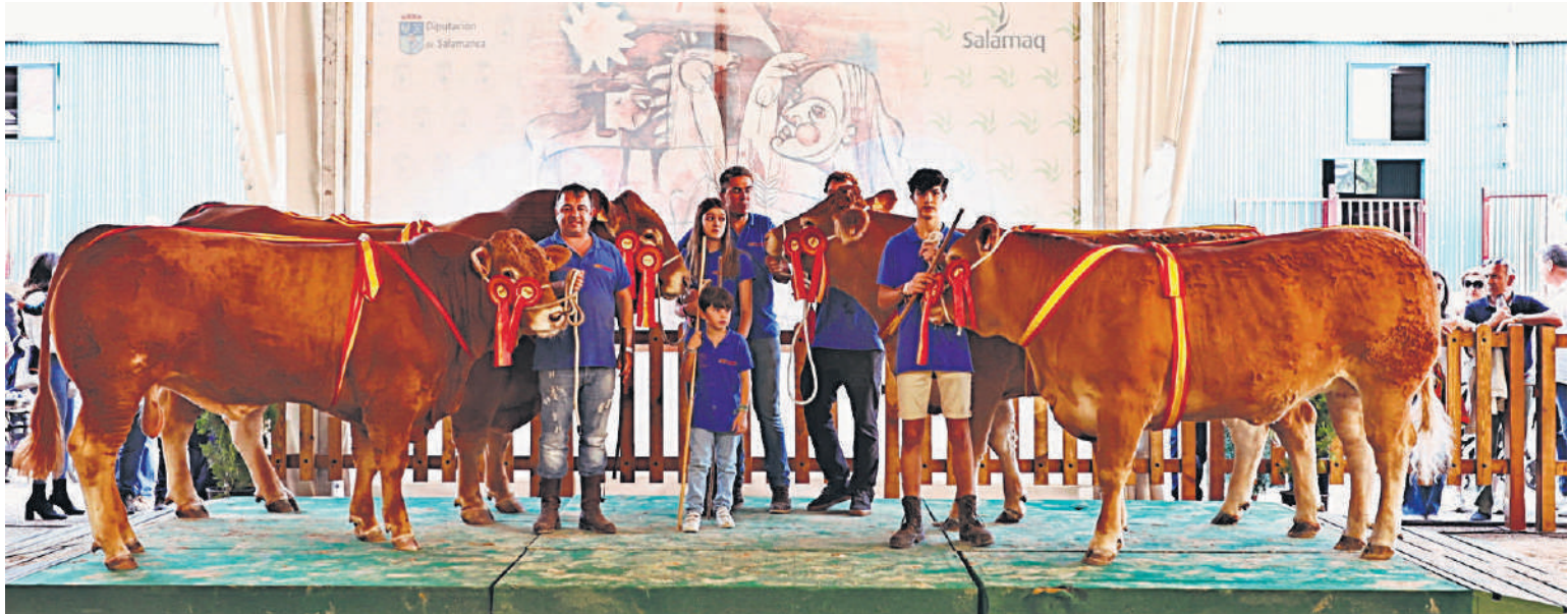
Grupo de ganadores de raza limusín.