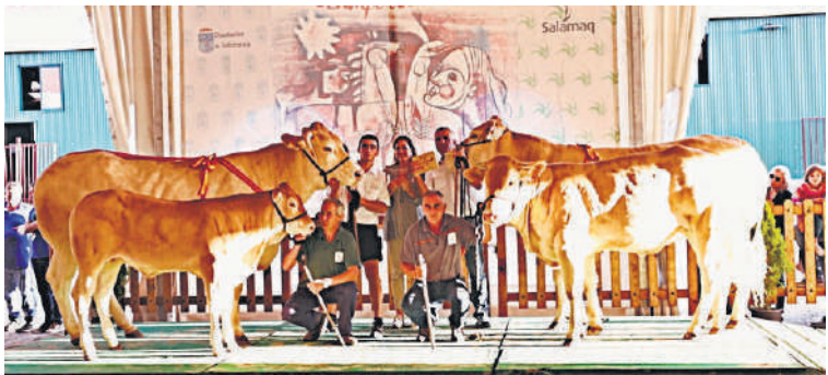
Mejor ganadería de raza blonde.

Día de cierre y, como es habitual, jornada para honrar a los campeones nacionales de los diferentes concursos como merecen: con banda, foto de familia de los ganaderos de las distintas razas con sus espectaculares ejemplares, y aplauso general al esfuerzo realizado por todos en el certamen y previamente en la preparación de los animales. Esto, los que ganaron y los que no. Faltó la morucha porque no es raza para salir a pista pero limusín, charolés y blonde lucieron las mejores galas.