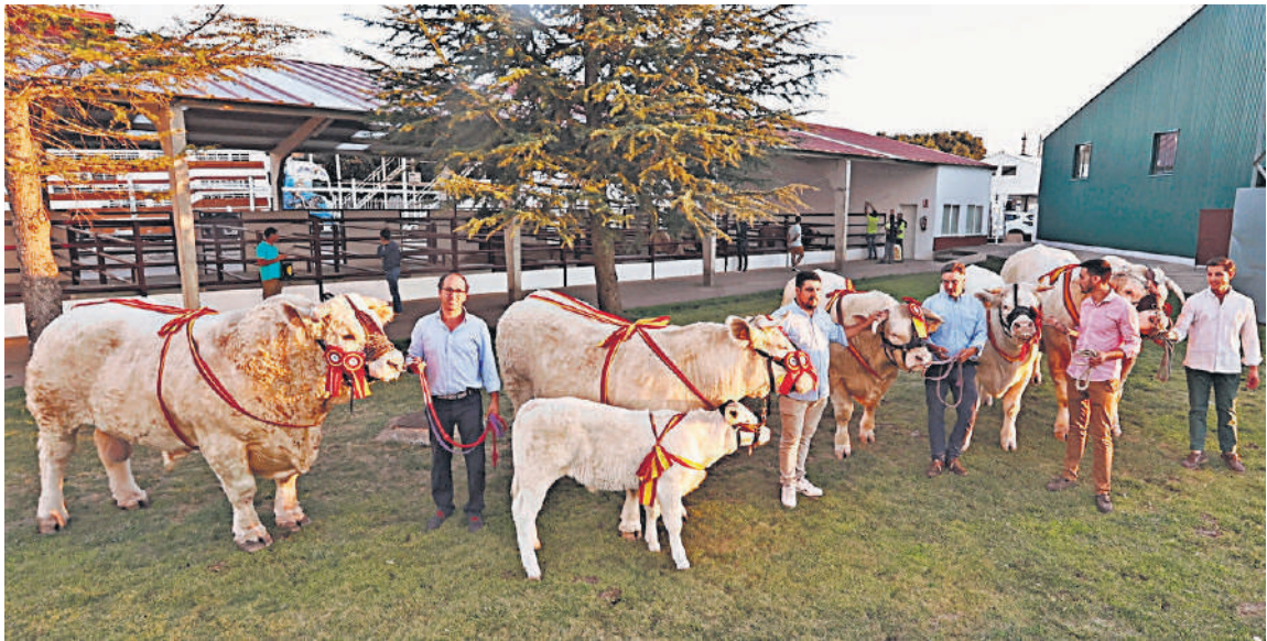
Foto de campeones de la raza charolesa.

Día de cierre y, como es habitual, jornada para honrar a los campeones nacionales de los diferentes concursos como merecen: con banda, foto de familia de los ganaderos de las distintas razas con sus espectaculares ejemplares, y aplauso general al esfuerzo realizado por todos en el certamen y previamente en la preparación de los animales. Esto, los que ganaron y los que no. Faltó la morucha porque no es raza para salir a pista pero limusín, charolés y blonde lucieron las mejores galas.