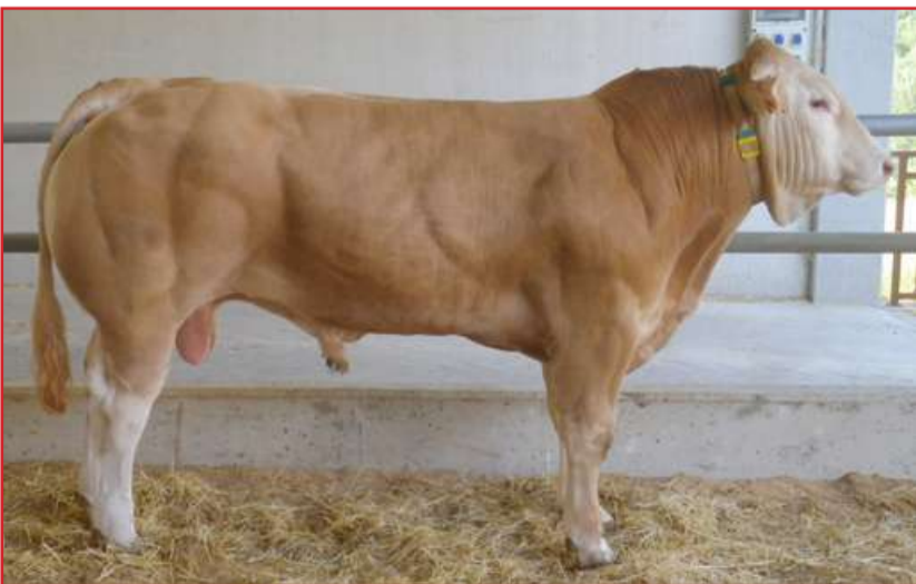
"Porrontxo", novillo de la raza Blonde de Aquitania, del ganadero José Ángel Zendoia, licitará en Salamanca con un precio de arranque de 2.800 euros, junto a otros dos sementales del mismo ganadero y otro de David Cortés

-José Ángel Zendoia, de Orio (Guipúzcoa): 1 semental de 16 meses por nombre "Poleón", 1 semental de 16 meses por nombre "Porrontxo" y 1 semental de 14 meses por nombre "Potxolo, Precio de arranque: respectivamente 2.750, 2.800 y 2.750 euros.