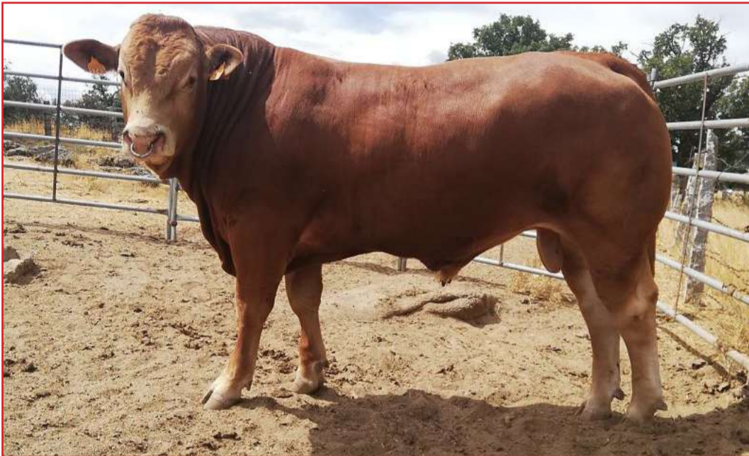
"Obelix PV", será subastado en Salamanca el sábado 10 de octubre, junto a otros 11 sementales Limusines de 8 ganaderías

A partir de esa hora del sábado, todo el personal abandonará el recinto y en el momento de iniciarse la subasta sólo estarán presentes los propietarios del ganado a subastar y la organización de la subasta.