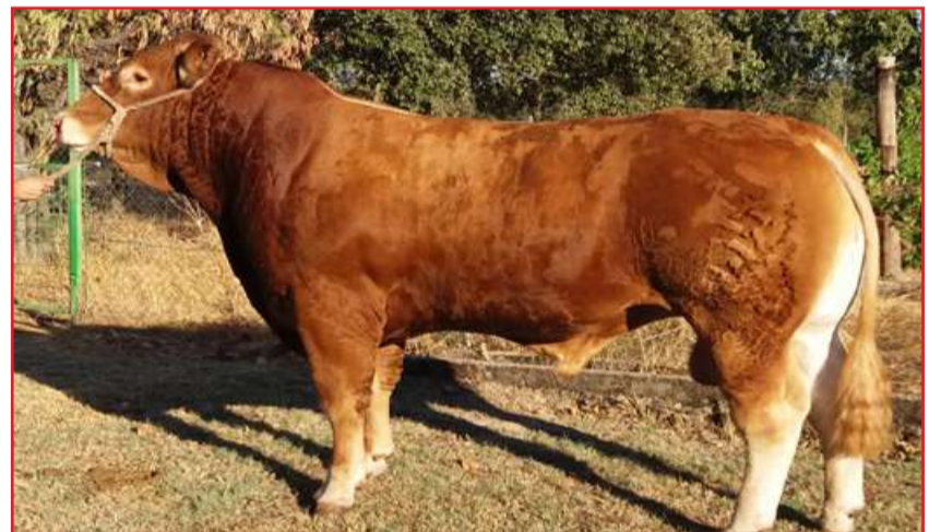
"Obelix PV", Limusín de la ganadería Candeleilla S.L. de 22 meses, y precio de salida 3.400 de euros, licitará en la Subasta Nacional de Salamanca

de 22 meses por nombre "Osek". Precio de arranque: 3.200 euros.