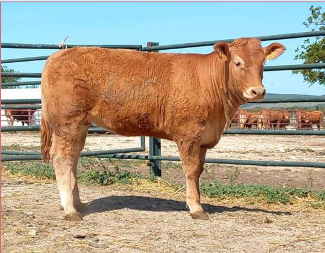
La Ganadería Concha Piquer licitará 8 novillas Limusín, entre ellas la de la imagen, de las cuales seis saldrán a 1.600 euros y dos a 1.800 euros