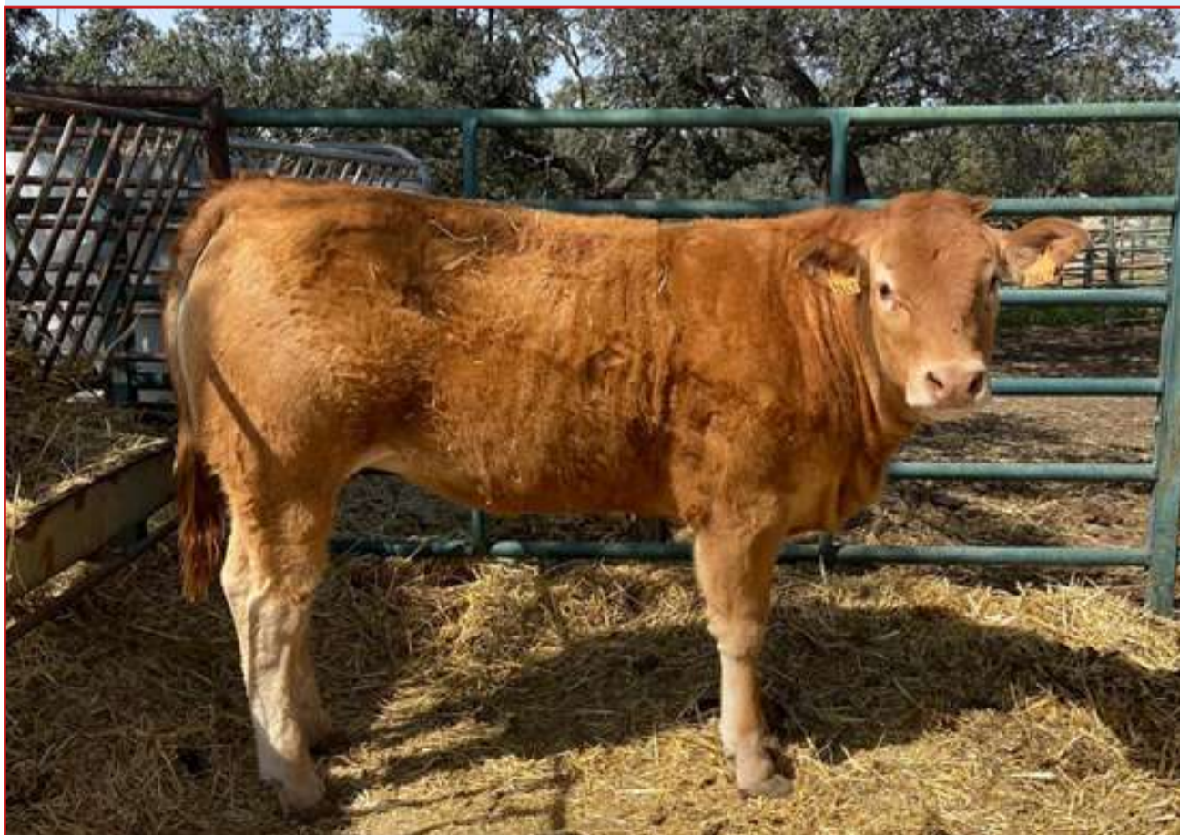
La Ganadería La Loma licitará esta novilla Limusín, con un precio de arranque de 1.600 euros; también La Cicuta subastará otra novilla, con un precio de salida de 1.700 euros