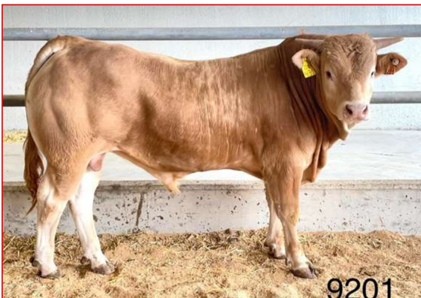
"G Imanol XIII", de Irumendi Elkartea, será uno de los 3 RD de raza Pirenaica que se subastarán en Aia, junto a 25 Reproductores de Aptitud Cárnica Blonda de Aquitania, Charolés y Limusín