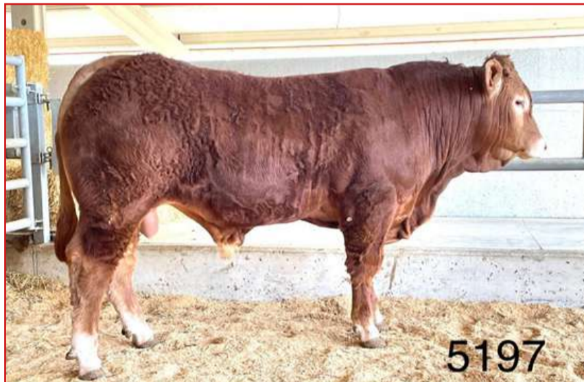
"Saga-Y", de Hnos. Aldalur Anaiak, será uno de los 7 RJ Limusín que se subastarán en Aia, junto a 4 Reproductores Oficiales de la raza Blonda de Aquitania

39 ejemplares -10 Reproductores Oficiales (7 RJ y 3 RP) y 28 Reproductores de Aptitud